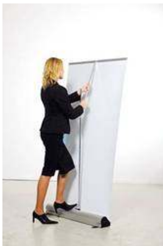
Sistemul Mark Bric

Sistemul nostru este prevazut cu trei tevi cromate care introdu-se una in cealalta permit ridicare bannerului. De remarcat faptul ca cele trei tevi sunt independente. Astfel sistemul poate fi montat cu usurinta si de persoane mai scunde sau imbracate astfel incat o intindere fortata a bratului poate duce la situatii neplacute. In plus faptul ca sunt independente elimina orice defect. Nu acelasi lucru se poate spune despre alte sisteme, la care cele trei tevi sunt prinse intre ele prin elastic. Acesta se rupe foarte usor si in felul acesta, cand ti-e lumea mai draga, nu poti monta sistemul si ... trebuie sa apelezi la scotch sau alte improvizatii ce pun in pericol prezentarea.