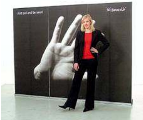
Sistemul Mark Bric

Datorita modului de executie al sistemului, este posibila interconectarea in vederea obtinerii unui panou grafic mai mare: