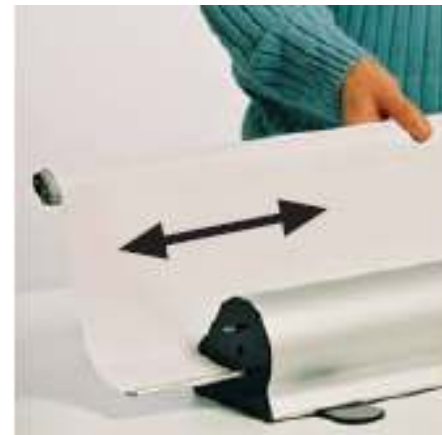
Sistemul Mark Bric

La celelalte sisteme bannerul se prinde prin intermediul unui dubluadeziv aplicat pe o bucata de material care iese din caseta. Schimbarea acestuia, este aproape imposibila fara deteriorarea acestei fasii si deci distrugerea sistemului.