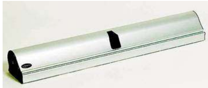
Sistemul Mark Bric

Caseta care contine sistemul este confectionata din aluminiu anodizat, are o forma care tine cont de o buna stabilitate a sistemului: