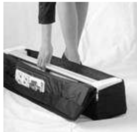
Sistemul Mark Bric

Sistemul nostru este ambalat intr-o geanta eleganta, de calitate (cu peretii captusiti) care nu doar protejeaza sistemul impotriva deteriorarilor dar nu ai de ce te jena cand esti imbracat elegant si esti nevoit sa manipulezi sistemul. Acest lucru nu este posibil la celelalte sisteme unde geanta este defapt un saculet, uneori chiar din material textil.